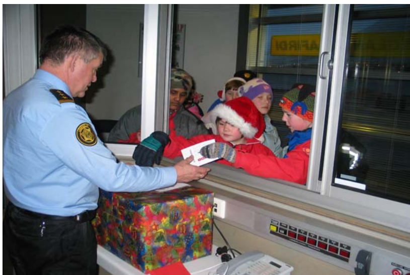
Yfirlögregluþjónn tekur á móti jólagetraunaseðlum ungra barna í umdæminu.

Í stefnumótun embættisins kemur m.a. fram, að bæta þurfi skjalastjórnun innan embættisins og að þörf sé á nýjum hugbúnaði vegna þessa. Þetta markmið náðist ekki á árinu 2004, en von er á úrbótum á árinu 2005, í tengslum við sérstakar áherslur tölvumiðstöðvar dómsmálaráðuneytisins. Á hinn bóginn voru lögð drög að verulegum umbótum er lúta að skilvirkni í tengslum við fyrirhugað samstarf lögreglunnar á Ísafirði við Fjarfskiptamiðstöð lögreglu. Dómsmálaráðherra veitti styrk til tækjakaupa til þess að unnt væri að nýta nýja tækni og gera varðstjóra kleift að fara á vettvang þegar þörf er á þannig að fjarfskiptamiðstöðin vakti lögreglustöð á meðan. Ráðherrann tilkynnti um styrkveitinguna í heimsókn sinni í embættið og opnar hún marga nýja möguleika við löggæslu í umdæminu.