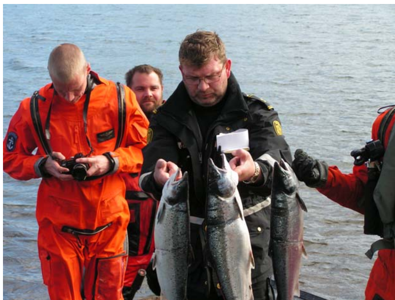
Við veiðiefirlit á Ströndum ásamt starfsmönnum LHG

Á heildina litið verður að telja að árið 2005 hafi verið friðsælt í umdæmi sýslumannsins á Ísafirði og ber að þakka það. Síðast en ekki síst ber að þakka starfsmönnum embættisins fyrir öflugt starf og ánægjulegt samstarf á árinu 2005.