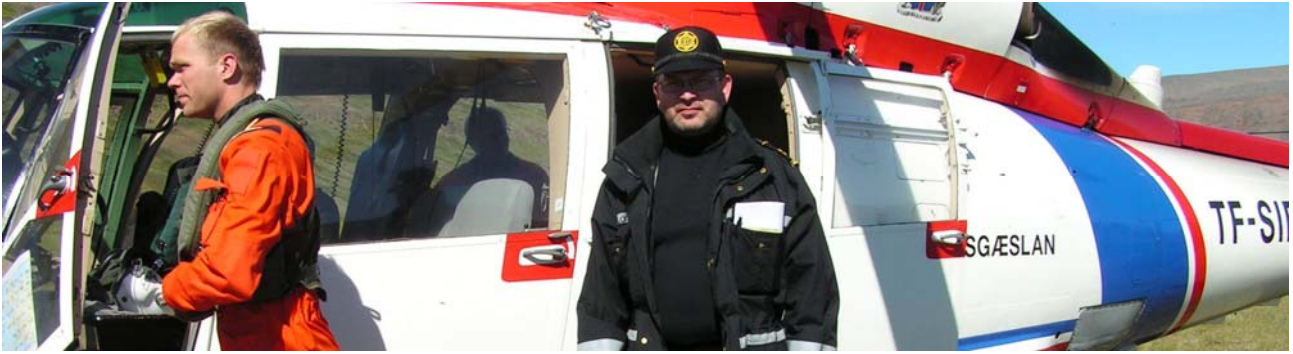
Veid eftirlisferð með þyrllu LHG