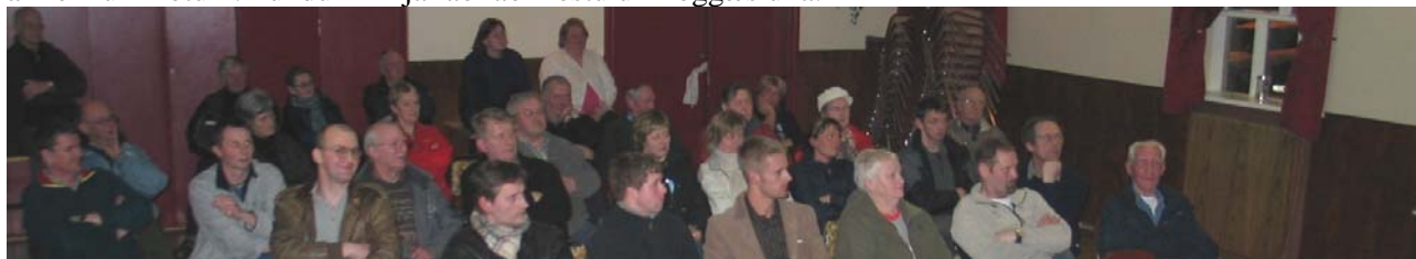
Frá borgarafundi á Þingeyri

Nauðsynlegt er að fá betri upplýsingar um afstöðu íbúa umdæmisins með þjónustukönnunum, en slíkar kannanir hafa ekki verið gerðar enn sökum kostnaðar. Haldinn var borgarafundur á Þingeyri í marsmánuði 2005 og var ánægjulegt að eiga kost á að heyra sjónarmið þeirra sem við þjónum, milliliðalaust og á almennum nótum. Fundurinn fjallaði að mestu um löggæsluna.