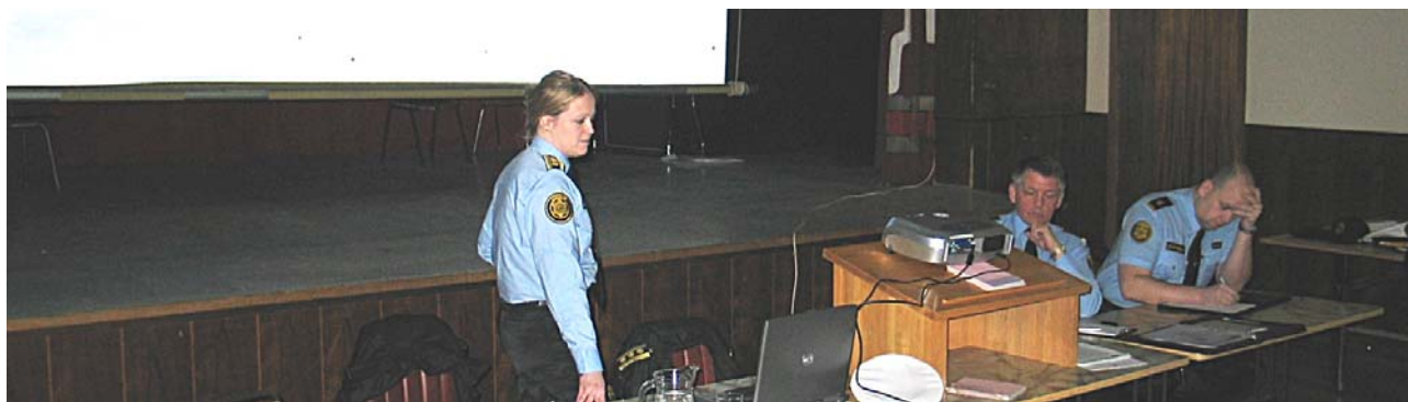
Frá borgarafundi á Þingeyri

Hugbúnaði vegna skjalastjórnunar er enn áfátt hjá embættinu, en vonir standa til að úr því verði bætt með vísan til þess að dómsmálaráðherra hefur undirritað þróunar- og samstarfssamning um Gopro málaskrákerfi og einhver embætti hafa þegar hafið þróunarverkefni með hið nýja kerfi. Ferlar eru nú til í flestum málaflokkum á sýsluskrifstofu og vísir að handbók er nú til hjá lögreglu.