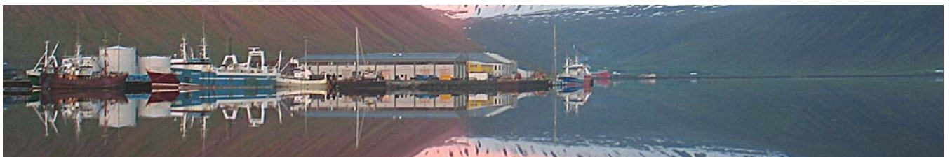
Sólsetur við Pollinn á Ísafirði

Umferðarskólinn var haldin fyrir elstu börnin í leikskólum Ísafjarðarbæjar og Súðavík dagana 16. til 19. maí 2005. Farið var yfir umferðarreglur, hvar börnin eiga að vera við leik og hvers ber að varast. Farið var í vettvangsferðir og lögreglustöðin og slökkvistöðin skoðuð, þar sem börnin fengu meðal annars að skoða sjúkrafreiðar. Þetta er í annað skiptið sem umferðarskólinn er haldinn með þessum hætti hjá lögreglunni á Ísafirði. Áberandi munur er á að heimsækja börnin í grunnskólann að hausti eftir að þau hafa fengið þessa fræðslu.