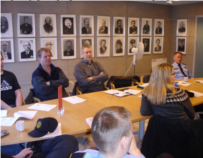
Fundur lögreglumanna vegna „Kletts“

Farið var í sérstakt fíkniefnaátak í ársbyrjun 2006 sem stóð í þrjá mánuði og fékk aðgerðin heitið „Kletturinn“ Ekki verður gefið upp hvaða starfsaðferðum var beitt en góður árangur náðist og má þakka því samheldni lögregluliðsins og áhuga manna á að efla þekkingu sína á þessu sviði. Má segja að átakið standi enn því mjög öflugt og virkt eftirlit er með mögulegum innflutningi og sölu fíkniefna í umdæminu.