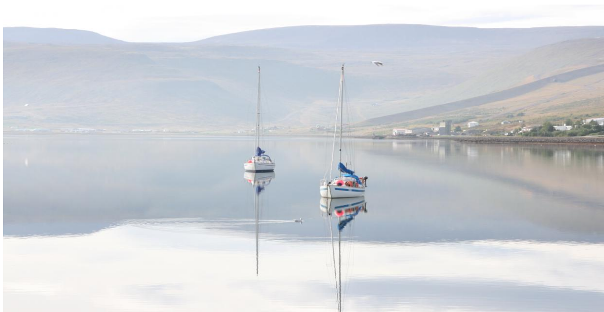
Skútur á pollinum á Ísafirði

Lögreglan á Vestfjörðum á gott samstarf við lögregluna í Borgarnesi og á Blönduósi og kemur þetta samstarf glögg í ljós vegna þjóðveg 1 um Holtavörðuheidi sem er í 150 kílómetra fjarlægð frá næstu varðstöð á Vestfjörðum, varðstöðinni á Hólmavík. Þá er samstarf við önnur lögreglulið jafnan gott og þá sérstaklega við lögregluna á höfuðborgarsvæðinu og embætti ríkislögreglustjóra. Lögreglan á gott samstarf við björgunarsveitir og sveitarstjórnir á Vestfjörðum.