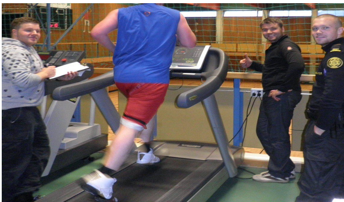
Er úthaldið gott?

Í rannsóknardeild lögreglustjórans á Vestfjörðum starfa lögreglufulltrúi og rannsóknarlög- reglumaður en lögreglufulltrúi er yfirmaður þess síðarnefnda. Rannsóknardeildin sinnir þeim verkefnum sem kveðið er á um í reglugerð nr. 192/2008, auk þeirra tilfallandi verkefna sem lögreglustjóri ákveður. Þrátt fyrir að umdæmið sé víðfermt hefur það ekki komið niður á rannsóknum mála. Þá reynir á samvinnu og samstarf starfsmanna rannsóknardeildar og annarra lögreglumanna í umdæminu, þ.e.a.s. á Hólmavík og á Patreksfirði. Samstarfið hefur verið með miklum ágætum. Hér verður gerð grein fyrir nokkrum þeirra brotaflokka sem komu til meðferðar hjá rannsóknardeild lögreglunnar á Vestfjörðum á árinu 2010. Hegningar- lagabrot voru 217 talsins og komu flest þeirra til meðferðar hjá rannsóknardeild. Ef frá eru talin umferðarlagabrot komu alls 109 sérreksilagabrot til meðferðar hjá embættinu og flest þeirra voru unnin í rannsóknardeild.