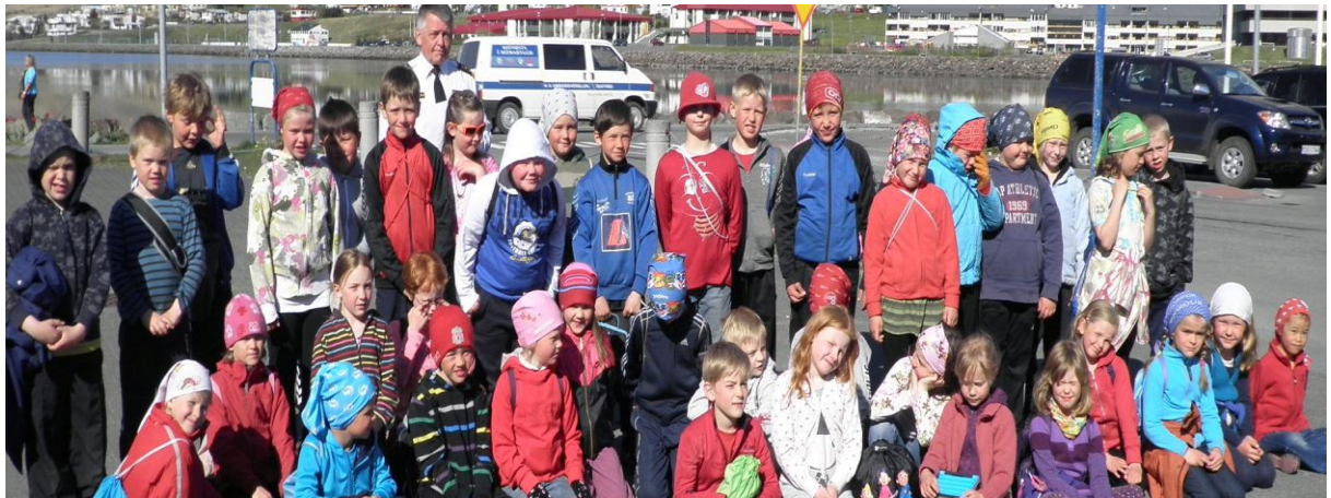
Yfirlögregluþjónn í hópi ungra grunnskólabarna