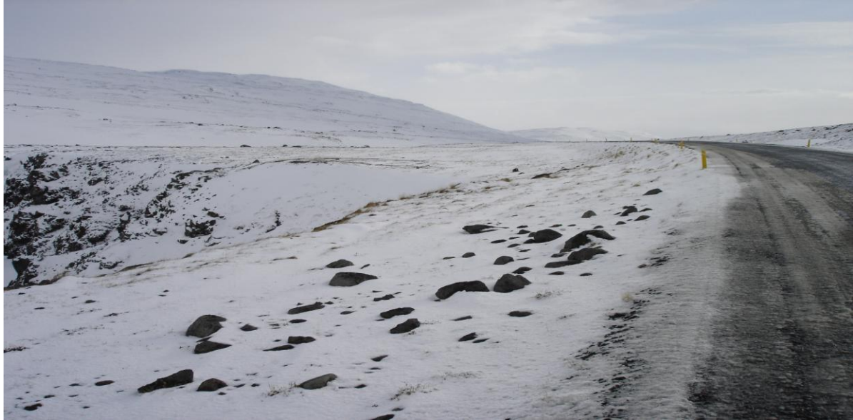
Viðsjárverður vegur um Steingrímsfjarðarheiði