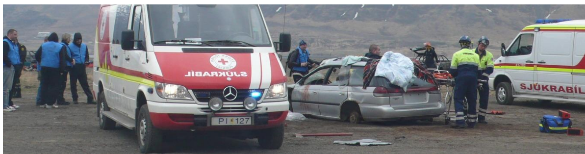
Frá flugslysaæfingu á Ísafjarðarflugvelli 2010

Aldrei kom til þess að kalla þyrfti saman almannaþarnanefndir vegna hættuástands en tvær flugslysaæfingar voru haldnar í umdæmi lögreglustjóra. Flugslysaæfingin Ísafjörður 2010 var haldin dagana 6. – 8. maí og flugslysaæfingin Bíldudalsflugvöllur 2010 fór fram dagana 23. – 25. maí. Æfingarnar voru með hefðbundnu sniði og fóru vel fram. Nýjar almannaþarnanefndir tóku til starfa í kjölfar sveitarstjórnarkosninga þann 29. maí. Unnið er að uppfærslu gagna hjá almannaþarnanefndum og annarri skipulagsvinnu. Í umdæmi lögreglustjórans á Vestfjörðum eru fimm almannaþarnanefndir. Ein almannaþarnanefnd fyrir Ísafjarðarbæ og Súðvíkurhrepp, tvær í Strandasýslu, ein í Reykhólahreppi og ein almannaþarnanefnd fyrir Tálknafjörð og Vesturbyggð. Haustið 2011 stendur til að halda flugslysaæfingu á flugvöllum á Gjögri og brunnaæfingu í Bolungarvíkurgöngum sem opnuð voru á árinu.