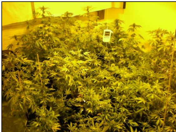
Mynd 10 Kannabisræktun.

Talsverðar breytingar voru á tölulegum upplýsingum milli ára en þær helstar eru að, grunaðir voru skráðir 146 talsins árið 2011 en voru 170 árið 2010. Gæsluvarðhaldsföngum fækkaði milli áranna 2010 og 2011, fóru úr 29 í 18 og gæsluvarðhaldsdagar fóru úr 823 dögum í 690 daga. Haldlagt amfetamín fór úr rúmum þremur kílóum árið 2010 í tæplega 400 grömm árið 2011. Aukning er í fljótandi amfetamíni og efnum til ætlaðrar framleiðslu amfetamíns, sem þykir benda til að framleiðsla efnisins hér á landi hafi færst verulega í aukana, enda virðist framboð efnisins ekki hafa minnkað. Rúm tvö kíló af kókaíni voru haldlögð en árið 2010 voru rúm fjögur kíló haldlögð. Aukning var í haldlögðum kannabisefnum, LSD, Ecstasy pillum (E-pillur) og MDMA dufti. Ein stærsta kannabisræktun sem