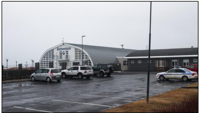
Mynd 6 Starfsstöð lögreglunnar er staðsett í íþróttamiðstöð Sveitarfélagsins Voga.

Á undanförunum árum hefur áherslan á hverfalöggæslu verið aukin markvisst hjá embættinu. Í dag eru staðsettar hverfastöðvar í Sveitarfélaginu Garði, Grindavíkurbæ, Sandgerðisbæ og Sveitarfélaginu Vogum. Á árinu vaknaði sú spurning hvort þörf væri á því að opna hverfastöð á Ásbrú en áætlaður íbúafjöldi þar er 1800 talsins. Í lok desember var endanleg ákvörðun tekin um að opna þar hverfastöð sem opna á í byrjun árs 2012.