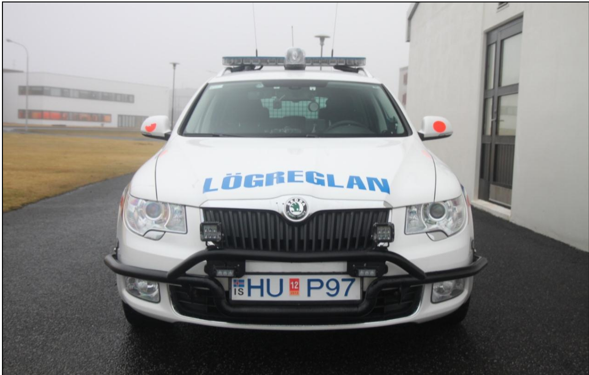
Mynd 2 Ný lögreglubifreið lögreglustjórans á Suðurnesjum, Skoda Suburb 2,0.

Svokallaðir hnífahanskar „keflar-hanskar“ voru keyptir fyrir lögreglumenn í öllum deildum embættisins en slíkir hanskar auka mjög á öryggi lögreglumanna. Allir lögreglumenn fengu einnig afhentar svokallaðar búnaðartöskur sem reynst hafa vel.