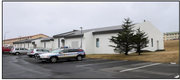
Mynd 7 Hverfislögreglustöð að Skógarbraut 945 á Ásbrú, Reykjaneshæ.

Verkefni hverfislögreglumanna hafa bæði verið fjölmörg og margbreytileg og hefur samstarf lögreglu við bæði bæjaryfirvöld og félagsþjónustu aukist hvað varðar lausn vandamála er viðkemur börnum og ungmennum. Með því hefur náðst að stöðva mun fyrr en ella eða draga verulega úr óæskilegri hegðun ungmenna og þess má geta að minniháttar eignarspjöllum hefur fækkað um 29% milli ára 2009 og 2011.