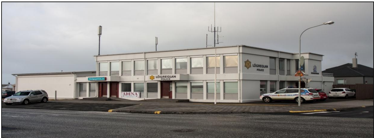
Mynd 8 Lögreglustöðin í Grindavík, Víkurbraut 25.