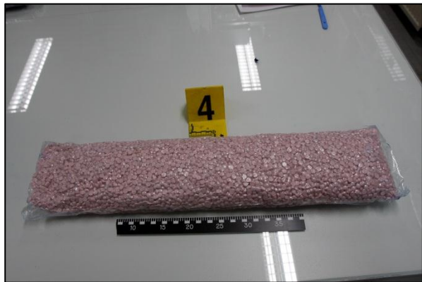
Mynd 9 Nokkur þúsund Ecstasy pillur er fundust í Flugstöð Leifs Eiríkssonar.

að geta mikilla og góðra samskipta við Tollgæsluna í Flugstöð Leifs Eiríkssonar, en þau samskipti hafa verið mjög fagleg og skilað sýnilegum árangri. Þá má einnig nefna mikil og góð samskipti við