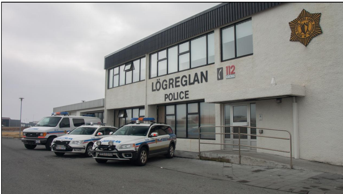
Mynd 3 Lögreglustöðin við Hringbraut 130, Reykjanesbæ.

Sífelld er unnið að endurbótum í samráði við Fasteignir ríkissjóðs en embættið hefur átt mjög gott samstarf við þá stofnun. Meðal annars var útisvæðið byggt við lögreglustöðina við Hringbraut fyrir fanga.