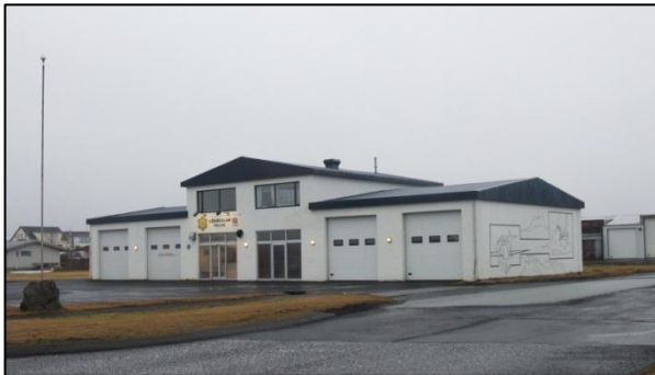
Mynd 5 Starfsstöð lögreglunnar í Sandgerði.

afbrotapróun innan bæjarfélaganna verið mjög virk og lögð áhersla á að grípa til sértekra aðgerða eftir þörfum.