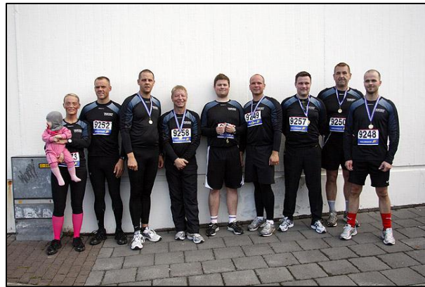
Mynd 4 Lögreglumenn á Suðurnesjum að loknu Ljósa-næturhlaupi.

Almannavörnum í umdæmi lögreglustjórans á Suðurnesjum er þannig háttað að tvær almannavarnanefndir eru starfandi þar, það er ein fyrir Grindavík og önnur fyrir allt umdæmið utan Grindavíkur. Almennavarnanefnd Suðurnesja er sameiginleg fyrir Sandgerði, Sveitarfélögin í Garði og Vogum, Reykjanesbæ og Keflavíkurflugvöll. Tilhneigingin á landsvísi hefur verið sú að fækka nefndum og stækka þær en auka áherslu á öflugra vettvangsstjórn í hverju byggðarlagi.